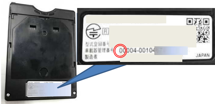
(写真): 旧セキュリティ対応車載器